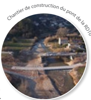
Chantier de construction du pont de la RD10

Suite à l'arrêté préfectoral de novembre 2014 autorisant la construction d'un nouveau pont, les travaux ont démarré début 2015. Ce nouveau pont permettra aux usagers de retrouver une circulation à double-sens et sera plus long que le précédent. En permettant le passage d'une plus grande quantité d'eau, il sera ainsi moins vulnérable aux inondations. La fin des travaux est prévue au premier semestre 2016.